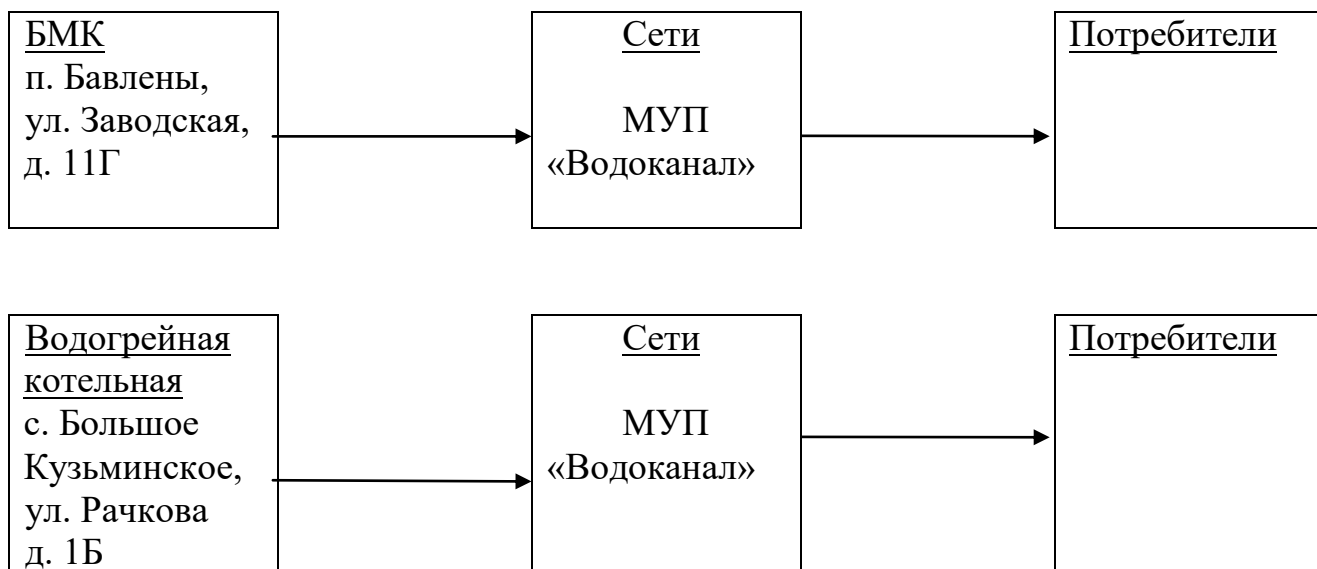
Рисунок № 1

В связи с тем, что в Бавленском поселении эксплуатация источников теплоснабжения и присоединённых тепловых сетей осуществляется разными юридическими лицами, необходимо предусмотреть согласованность действий между оперативным и эксплуатационным персоналом данных предприятий, в т.ч. за счёт принятия единых внутренних регламентов и инструкций.