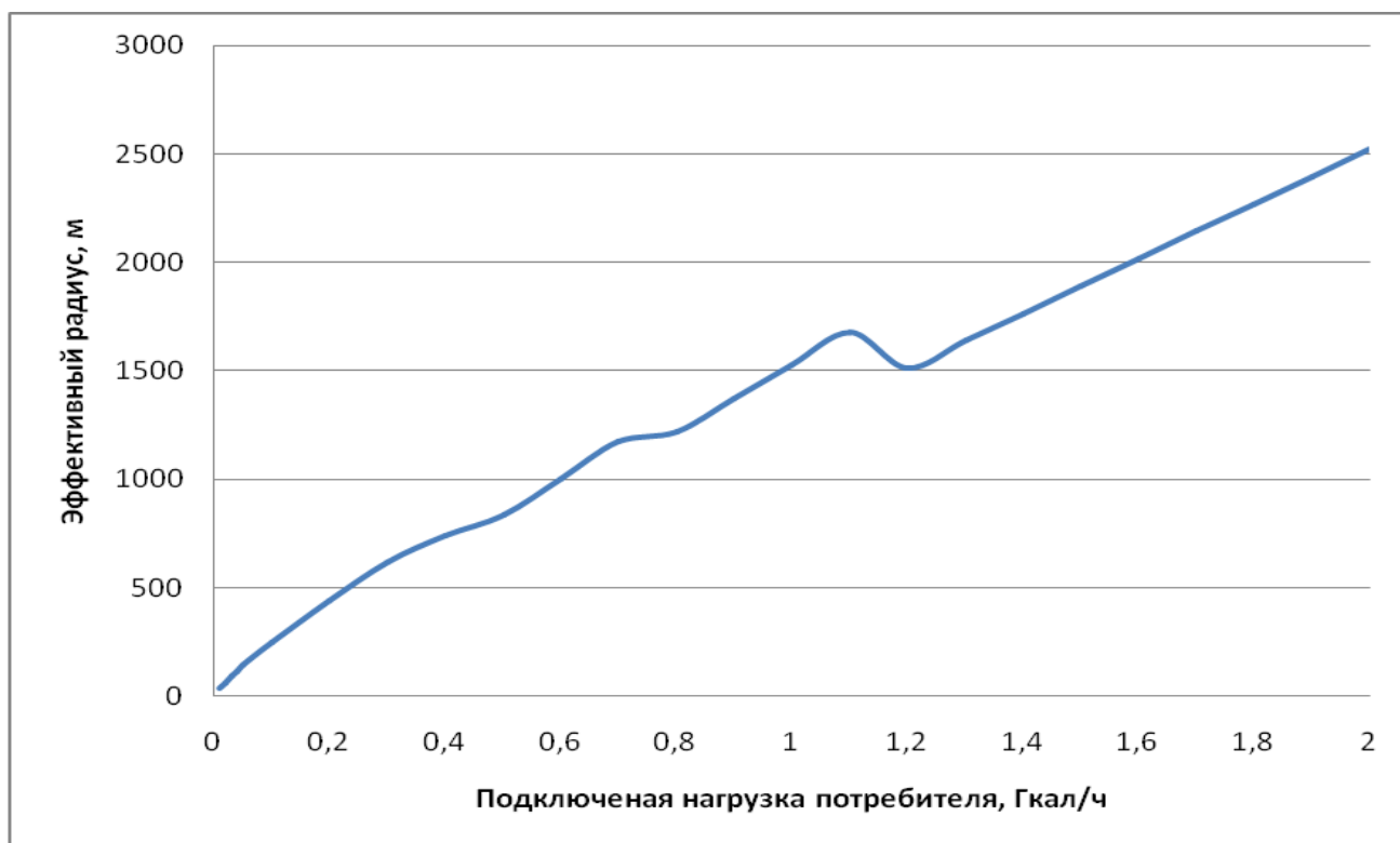
Рисунок № 1

Радиус теплоснабжения в графическом виде представлен на рисунках №№ 1, 2.